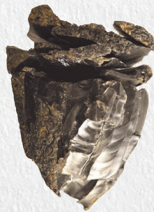
細石刃核 重要文化財 福井洞窟 第1トレンチ12層出土