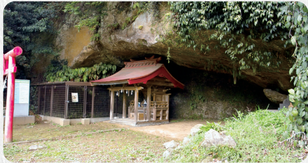
福井洞窟 史跡 所在地:佐世保市吉井町福井

洞窟でのくらしと文化の移り変わりを知る上で重要な史跡であり、昭和と平成に発掘調査が行われました。出土品は、令和2年9月に国の重要文化財として指定され、福井洞窟ミュージアムで常設展示しています。