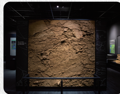
2mの落石の剥ぎ取り地層