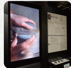
石器の作り方(映像)