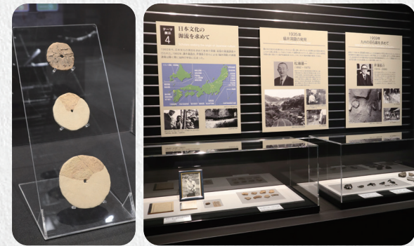
左:土製有孔円盤 右:福井洞窟の第1次発掘調査に携わった人物と出土資料

昭和30年代に行われた第1次発掘調査時の資料や、調査研究に携わった考古学者の研究成果やエピソードなどを半世紀ぶりに里帰りの資料と共に紹介しています。