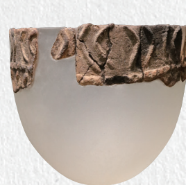
隆起線土器 (レプリカ)